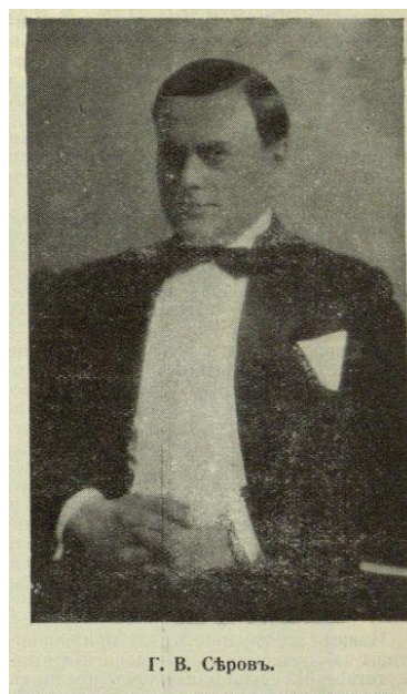
Иллюстрированная Россия. 1929. №41. С.13