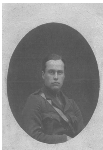
А.В. Серов в 1930-е гг.