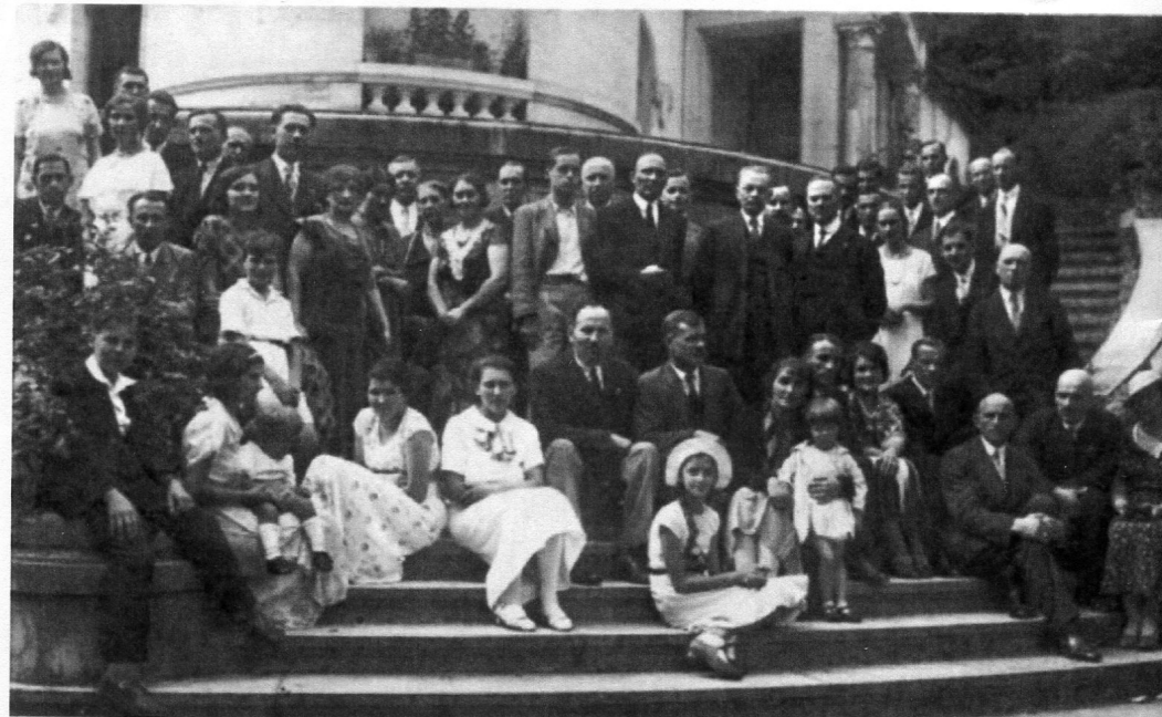
Обитатели замка после воскресной литургии / Groupe de Russes sur les marches de l'escalier du château, un dimanche après la liturgie

своё имущество, немедленно купленное директором бумажных фабрик Клебером.