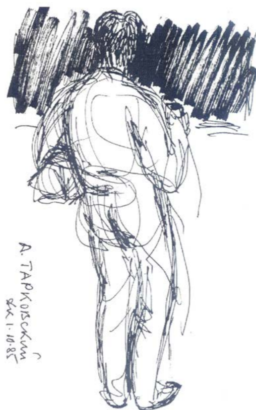
Андрей Тарковский, 1985

Но еще большее впечатление ожидает вас, когда попадете в этот удивительный дом. Старые книги, русские пейзажи с церквями, кладбищенскими крестами и снова — лица. Вдоль лестницы на третий этаж — сплошные портреты. Написанные или нарисованные, кажется, с одного взмаха, но безошибочно определяющие характер героя. Высоцкий, Рихтер, Айги, Окуджава, Целая галерея образов «небожителей» русского Парижа — Одоевцева, Целков, Ростропович, Галич, Синявский, Померанцев, Шаховская, Амальрик, Гинзбург, Хвостенко, Сеземан, Лосская. А еще — деревянные скульптуры, среди которых выделялся своей мощью бюст Солженицына, ныне переданный в Дом зарубежья. из тульских мужиков