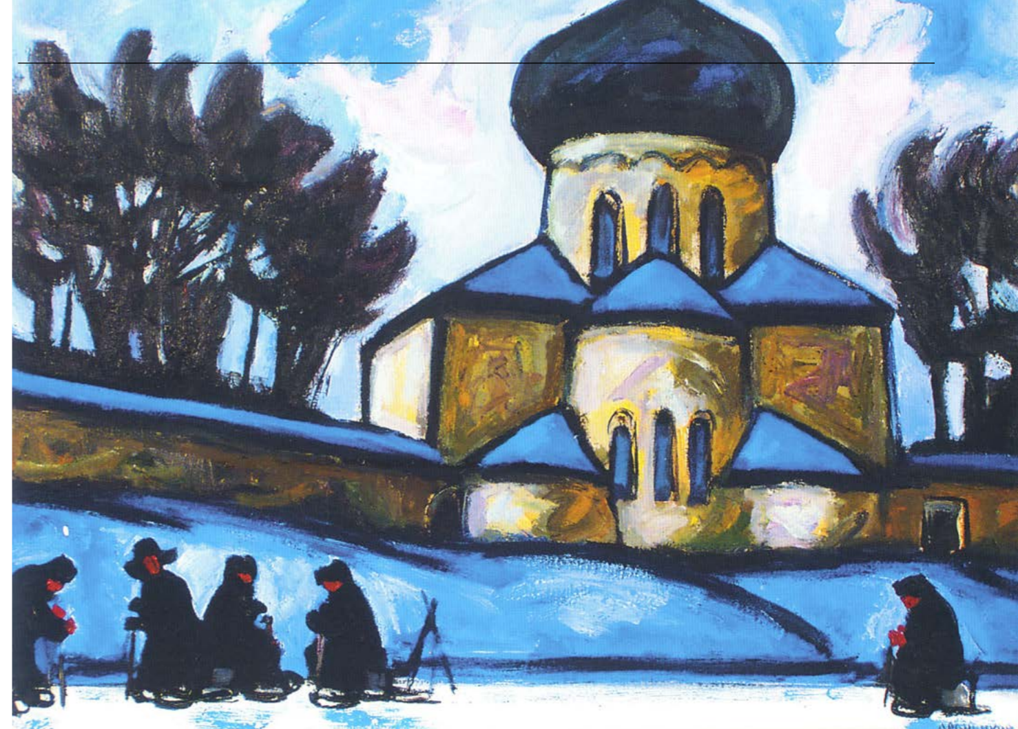
Мирожский монастырь, 1964-1974

«Старая эмиграция дала мне печатный станок и несколько ящиков металлического шрифта. И я мог печатать книжки, в которых защищал старую Россию... Мне дали этот станок, чтобы я отстаивал Россию от диссидентской московской кухни, от этой пены третьей волны...»